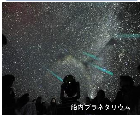
船内プラネタリウム