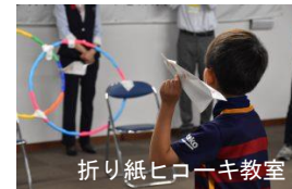
折り紙ヒコーキ教室

※○8日のみ開催、◎9日のみ開催、●両日開催 ※入場券の販売、整理券の配布は岸壁受付で行います